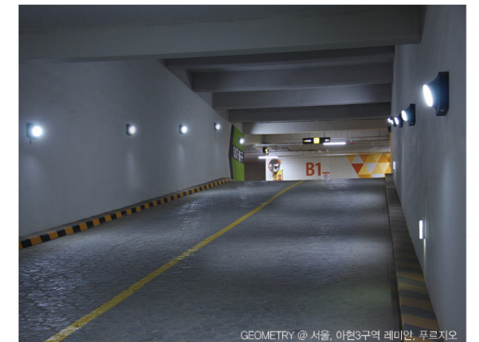
GEOMETRY @ 서울, 아현3구역 레미안, 푸르지오

Energy Saving 74% LED 40W vs Metal halide 150W